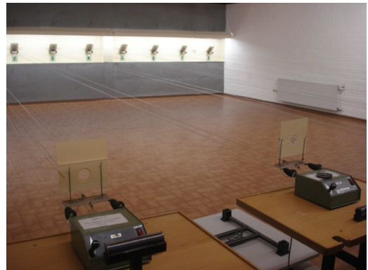
Auf dem Schießstand