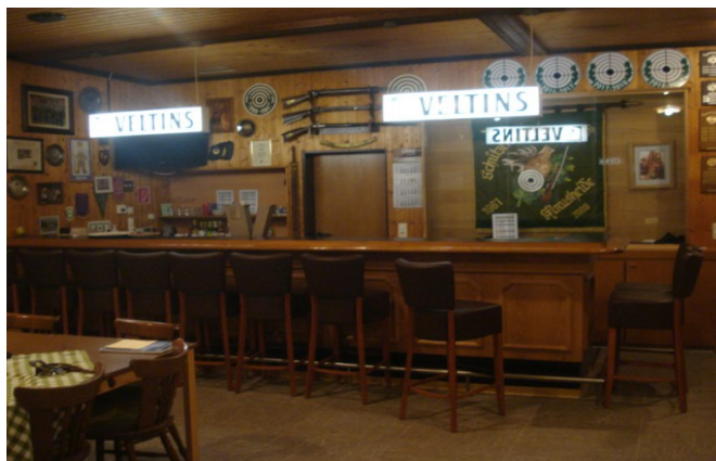
Aufenthaltraum Thekenbereich in der Schießhalle

Anträge zum Jugend-Delegiertentag müssen bis zum 21. Juni 2015 schriftlich bei der Geschäftsstelle des Schützenbundes eingegangen sein.